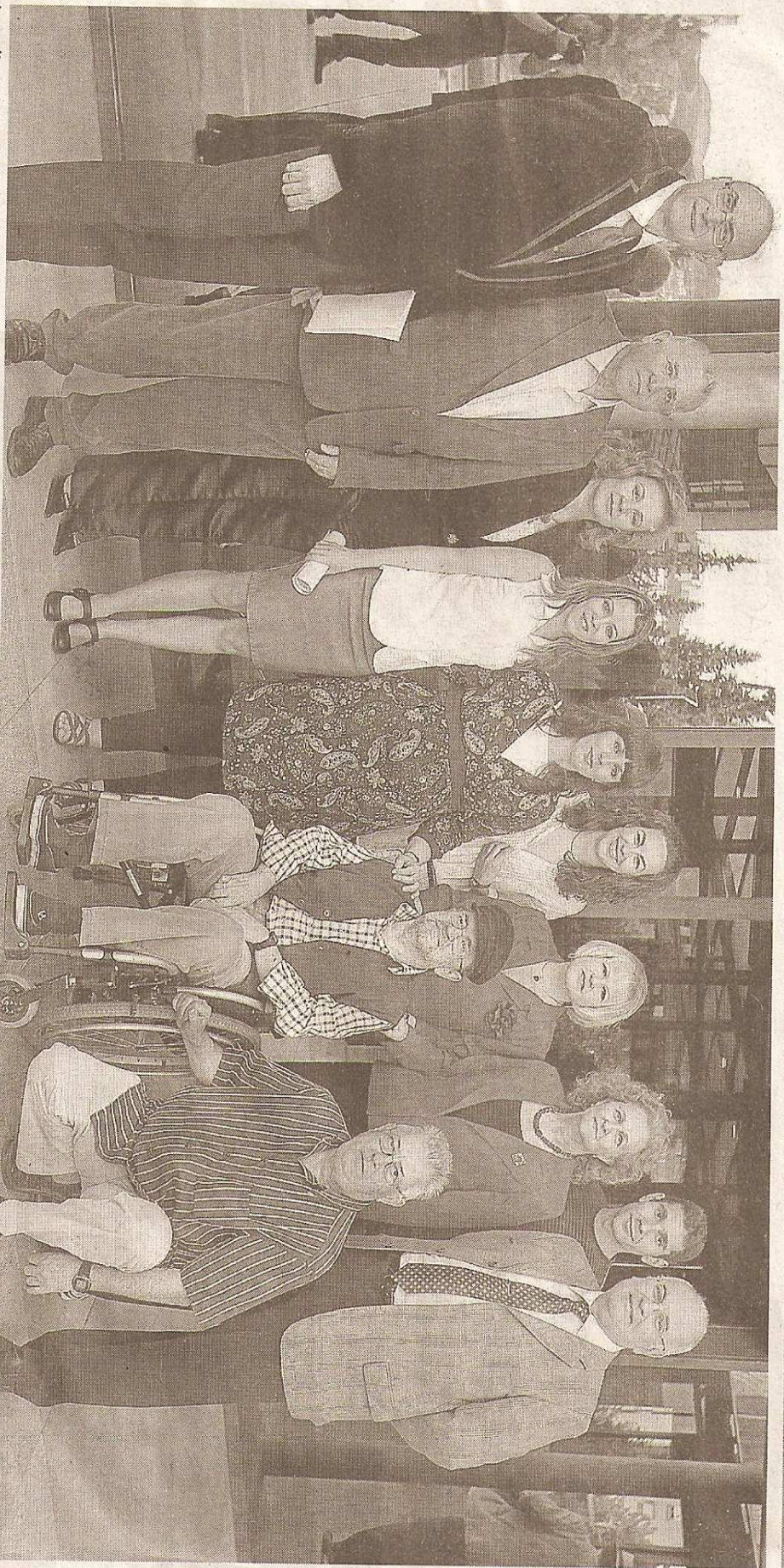
Los directivos de la asociación posan poco antes de comenzar la gala en el salón de actos de la Caja Rural.